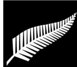
Equipe 4 : Les All-Blacks