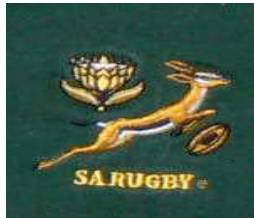
Equipe 3 : Les Springboks